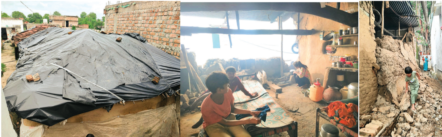
हरिभूमि न्यूज कालापील

प्रधानमंत्री आवास योजना के तहत 50 से अधिक दलित परिवारों को नहीं मिल रहा लाभ