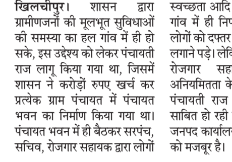
खिलचीपुर। शासन द्वारा ग्रामीणजनों की मूलभूत सुविधाओं की समस्या का हल गांव में ही हो सके, इस उद्देश्य को लेकर पंचायती राज लागू किया गया था, जिसमें शासन ने करोड़ों रुपए खर्च कर प्रत्येक ग्राम पंचायत में पंचायत भवन का निर्माण किया गया था। पंचायत भवन में ही बैठकर सरपंच, सचिव, रोजगार सहायक द्वारा लोगों

की मूलभूत सुविधाएं जैसे विधवा पेंशन, वृद्धावस्था पेंशन, जन्म प्रमाण पत्र, मूल निवासी प्रमाण पत्र, आवासीय, शौचालय, शासन द्वारा ग्रामीणजनों की मूलभूत सुविधाओं की समस्या का हल गांव में ही हो सके, इस उद्देश्य को लेकर पंचायती राज लागू किया गया था, जिसमें शासन ने करोड़ों रुपए खर्च कर प्रत्येक ग्राम पंचायत में पंचायत भवन का निर्माण किया गया था। पंचायत भवन में ही बैठकर सरपंच, सचिव, रोजगार सहायक द्वारा लोगों