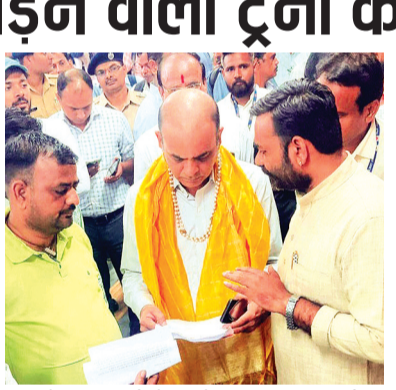
जिससे दर्शनार्थियों के लिये यातायात सुलभ होगा और कलकत्ता रेल सुविधा से बुन्देलखण्ड के जिलों के गेहू एवं कपड़ा व्यवसायियों को लाभ मिलेगा साथ ही राज्य सरकार और भारत सरकार के राजस्व में भी बढ़ोत्तरी होगी। इस हेतु रेल मार्ग निम्न प्रकार प्रस्तावित है:- उज्जैन (महाकाल), भोपाल, सांची, विदिशा, गंजबासोदा बीना, ललितपुर, टीकमगढ़, छतरपुर, खजुराहो, महोबा, चित्रकूट, प्रयागराज, गयाजी, पारसनाथ, हावड़ा

ललितपुर। रेलवे स्टेशन पहुंचे मण्डल रेल प्रबंधक झांसी का ललितपुर सेवा गुप ने आत्मीय स्वागत करते हुये तमाम ट्रेनों के स्टॉपेज स्वीकृत किये जाने की मांग को लेकर ज्ञापन दिया। बताया कि सम्पूर्ण बुन्देलखण्ड प्रमुख रूप से ललितपुर, टीकमगढ़, छतरपुर, जिले के हिन्दू यात्रियों को प्रसिद्ध तीर्थस्थल गयाजी (बिहार), दक्षिणेश्वर काली मंदिर कलकत्ता (पश्चिम बंगाल) एवं जैन यात्रियों को जैन तीर्थराज सम्मंद शिखरजी जौन के लिये पारसनाथ स्टेशन (झारखंड) और कलकत्ता जाने के लिये सभी व्यापारियों को आने जाने के लिये सीधी रेल सेवा का संचालन नहीं है। जिससे ललितपुर, टीकमगढ़, छतरपुर, जिलों के लोगों को यात्रा करने में बहुत परेशानियों का सामना करना पड़ता है। इसके लिए एक सीधी रेल सेवा चलाई जाये जो उज्जैन, भोपाल सांची, विदिशा, गंजबासोदा, बीना, ललितपुर, टीकमगढ़, छतरपुर, खजुराहो, महोबा, चित्रकूट, प्रयागराज, गयाजी, पारसनाथ, हावड़ा स्टेशन कलकत्ता की ओर रेल सुविधा उपलब्ध हो