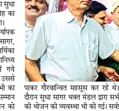
पाकर गौरवान्वित महसूस कर रहे थे। इस दौरान सुधा सागर भक्त मंडल द्वारा सभी को भोजन की व्यवस्था भी की गई। सर्वप्रथम

पर्वराज पर्वपूषण पर्व में श्रावक संस्कार शिविरों में ललितपुर जिले से गए शिवारथियों का सुधा सागर भक्त मंडल द्वारा सम्मान समारोह का आयोजन स्थानीय मैरिज गार्डन में किया। जिसमें आचार्यश्री समय सागर, निर्वापक मुनि सुधासागर, वीरसागर, मुनि प्रभासागर, आचार्य विशुद्ध सागर महाराज, आर्यिका पूर्णमति माताजी व अन्य साधुगणों के सानिध्य में लगे श्रावक संस्कार शिविर में गये शिवारथियों का जिन्होंने 10 उपवास उससे कम उपवास कर साधना की, उन सभी का पाण्डो व माला पहनाकर स्मृति चिन्ह सम्मान किया गया। सभी शिवारथी इस सम्मान को